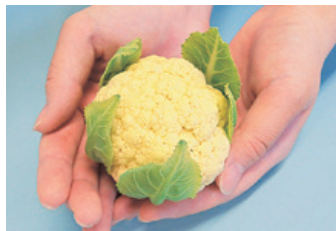
早どりで美味しいいただく「姫かりふ®」

田野畑村のシタケ生産者に導入された入門用夏どりイチゴの栽培システムは、入門用の役割を果たし、生産者が初めて栽培したにもかかわらず、この夏を通してイチゴが出荷されました。そこで、その栽培や販売の方法、課題を議論するために、10月に研究会「三陸で夏イチゴを作ろう in 田野畑」を開催したところ、岩手県だけでなく、東京、青森からの40名近くの参加者が活発に討議し、夏イチゴ生産拠点として、三陸のポテンシャルの高さが感じられました。来年は大槌町にもこの夏イチゴ栽培システムが導入されます。