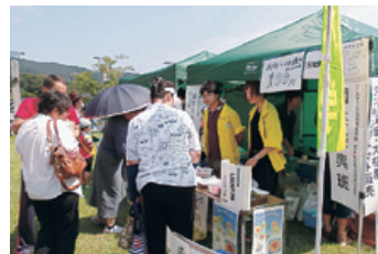
クッキングマト販売イベントの様子