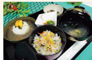
地区代表となった種市南漁協の料理。「あまり高価でなくても、高級感のある料理に仕上げました」とのコメントです。

連絡先 久慈エクステンションセンター 〒028-8030 岩手県久慈市川崎町1番1号 久慈市役所 (3階) 産業開発課内 TEL : 090-2953-2519 E-mail : kujjext@iwate-u.ac.jp