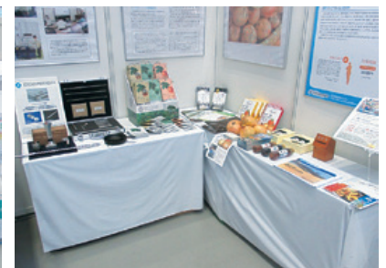
岩手大学ブースの様子