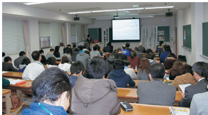
聴講者で後ろまで埋まった講義室